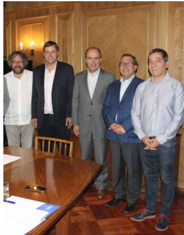
Directiva AChM, visita protocolar Ministro de Vivienda Cristián Monckeberg.

Gobierno y municipios firman acuerdo para terminar con loteos irregulares: Bienes Nacionales y las municipalidades generarán una mesa de trabajo que permita terminar con la generación de estos loteos.