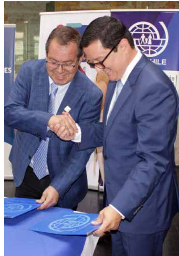
Firma convenio latinoamericano OIM-AChM.