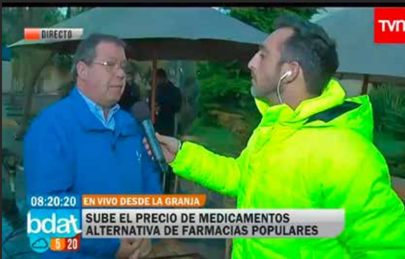
▲ Pdte. de la AChM en Programa Buenos Días a Todos, se refiere a las farmacias populares.