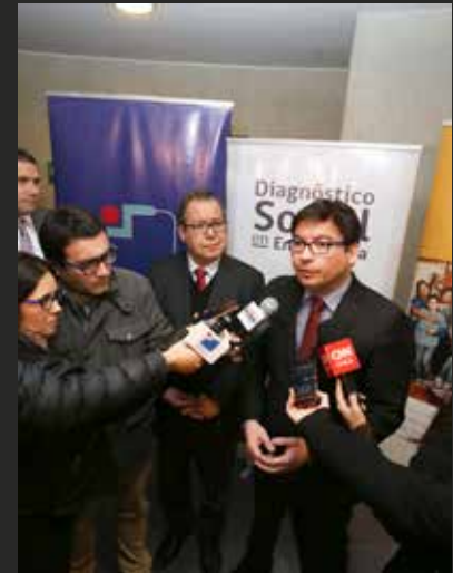
▲ Pdte. AChM sobre Ley de tenencia responsable de mascotas.