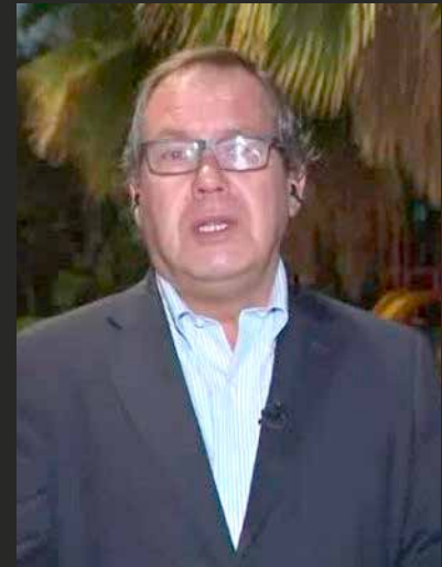
▲ Presidente AChM sobre el paro de profesores en contacto en directo para Chilevisión Noticias.