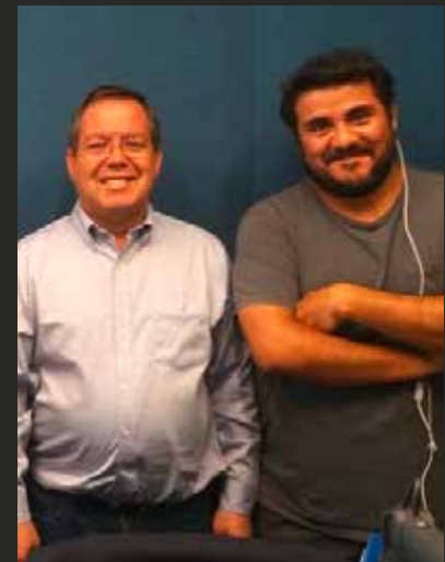
▲ Pdte. AChM, estrenando una nueva temporada de Municipio al Día en Radio Cooperativa.