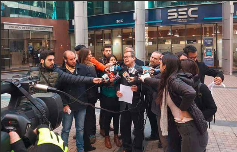
▲ Municipios denuncian a Enel ante la SEC.