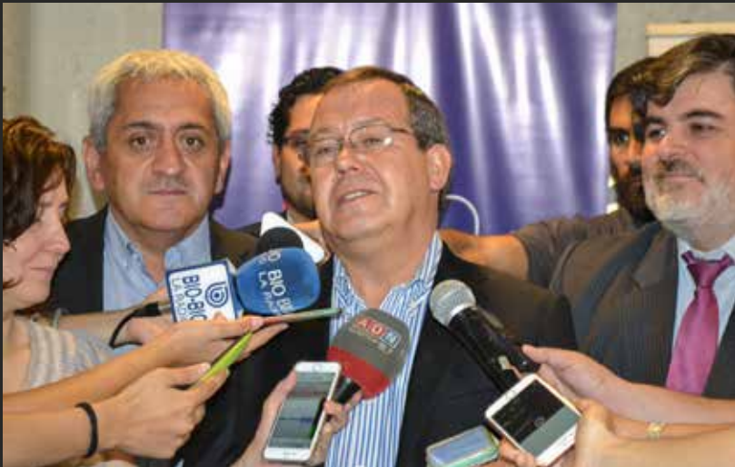
▲ Conferencia de prensa Pdte. AChM por el tema de la salud.