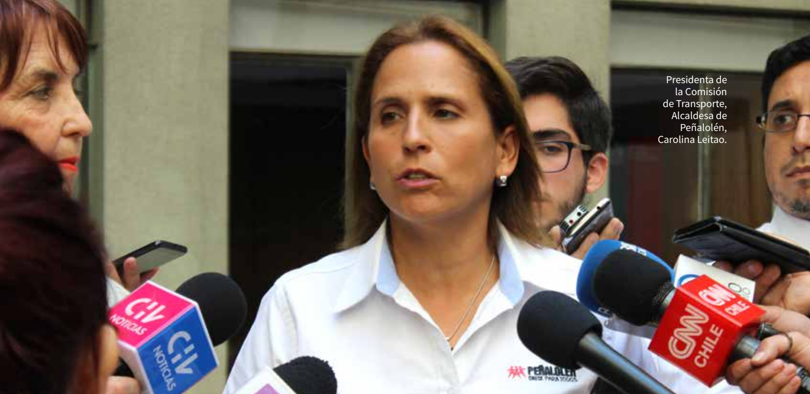
Presidenta de la Comisión de Transporte, Alcaldesa de Peñalolén, Carolina Leitaó.