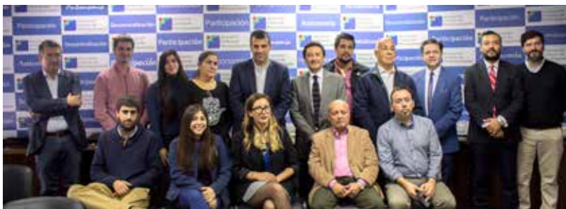
Presidente de la Comisión de Asuntos Migrantes, Alcalde de Estación Central, Rodrigo Delgado, participando del primer encuentro de periodistas migrantes de la Región Metropolitana

municipios en la recepción de migrantes en las comunas. Este convenio se firmó para que las comunas se capacitaran en temas que afectan a los migrantes como: salud, educación, vivienda e inserción laboral.