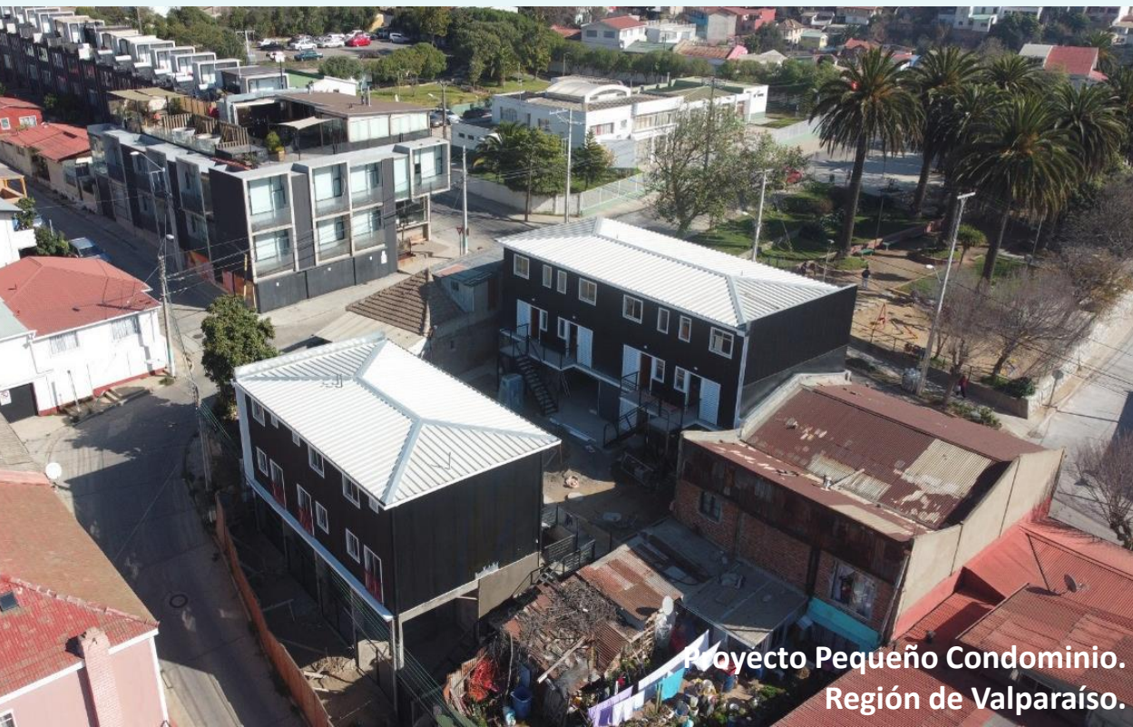
Proyecto Pequeño Condominio. Región de Valparaíso.

Se consideran selecciones permanentes, permaneciendo abierto hasta la primera semana de diciembre o hasta agotar los recursos programados.