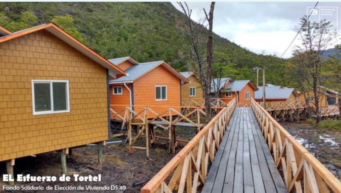
EL Esfuerzo de Tortel Fondo Solidario de Elección de Vivienda DS 49

Se dispondrá del banco de postulaciones abierto permanentemente para la recepción de proyectos desde enero 2023, realizándose un primer cierre en febrero.