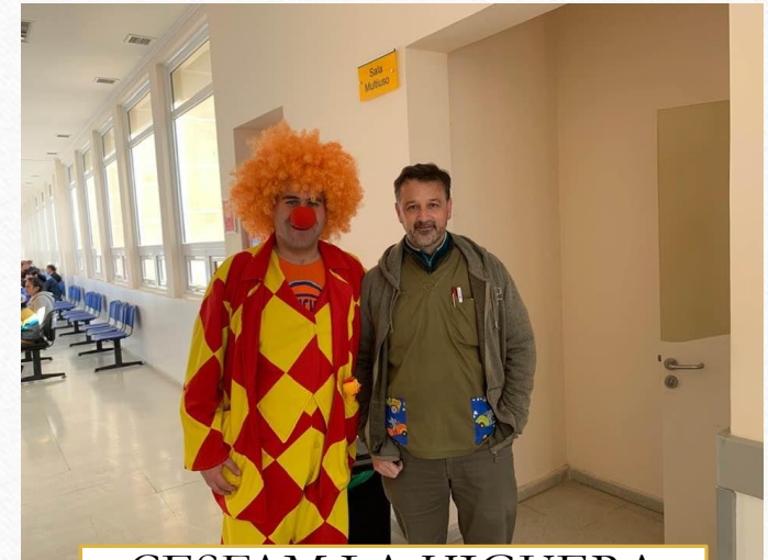
CESFAM LA HIGUERA 2019