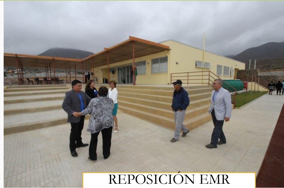
REPOSICIÓN EMR CHUNGUNGO