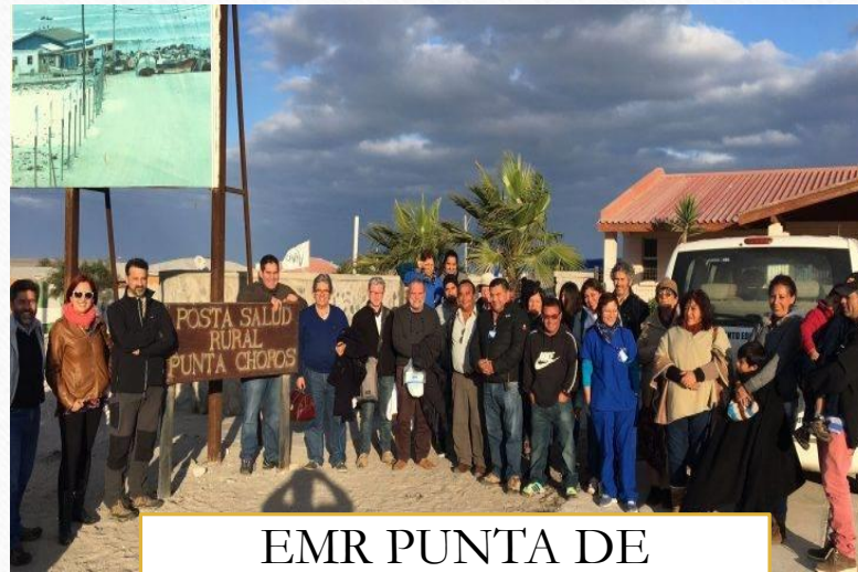
EMR PUNTA DE CHOROS 2017