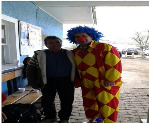
CES LA HIGUERA 2015