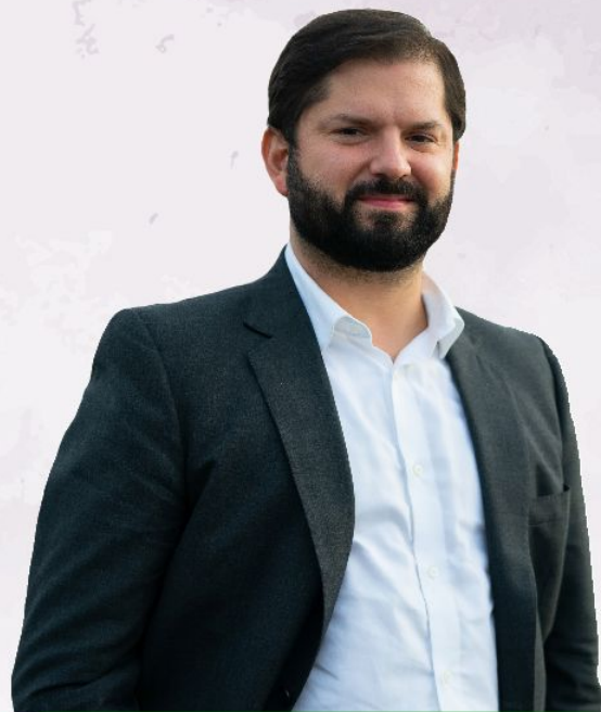
Gabriel Boric Font