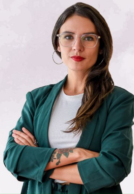
Camila Vallejo Dowling