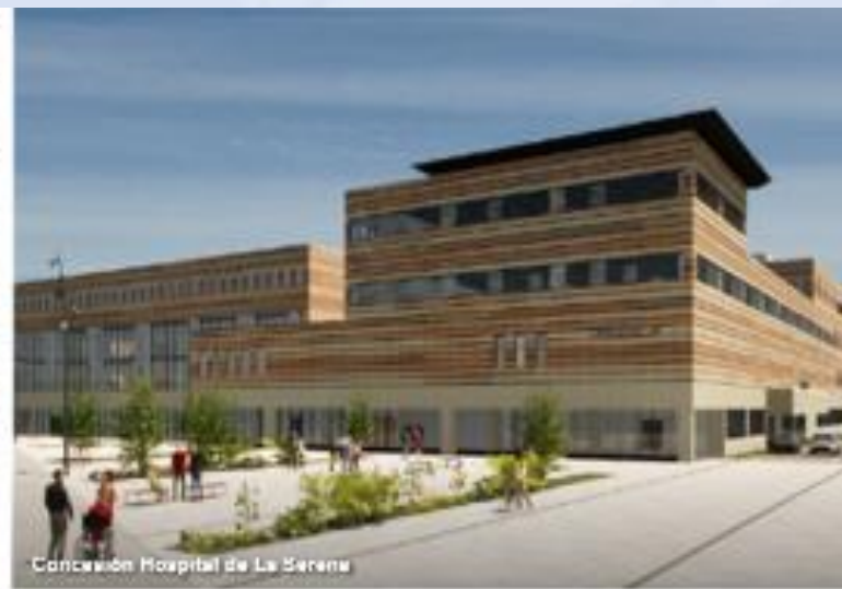
Concesión Hospital de La Serena