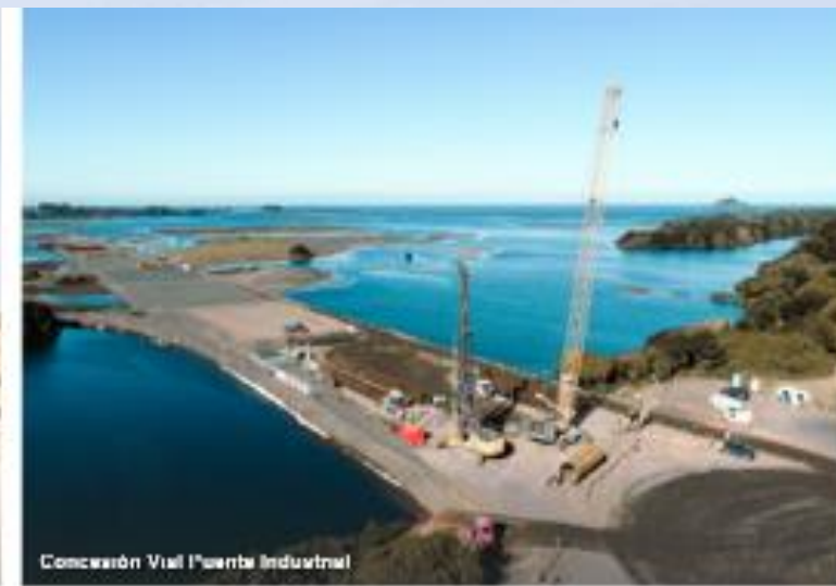
Concesión Vial Puente Industrial