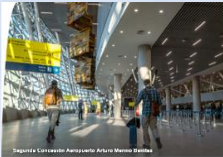
Segunda Concesión Aeropuerto Arturo Merino Benítez