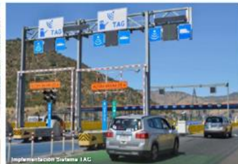
Implementación Sistema TAG