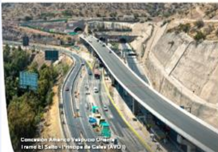
Concesión Américo Vespucio Oriente Tramo El Salto - El Príncipe de Gales (AVO II)