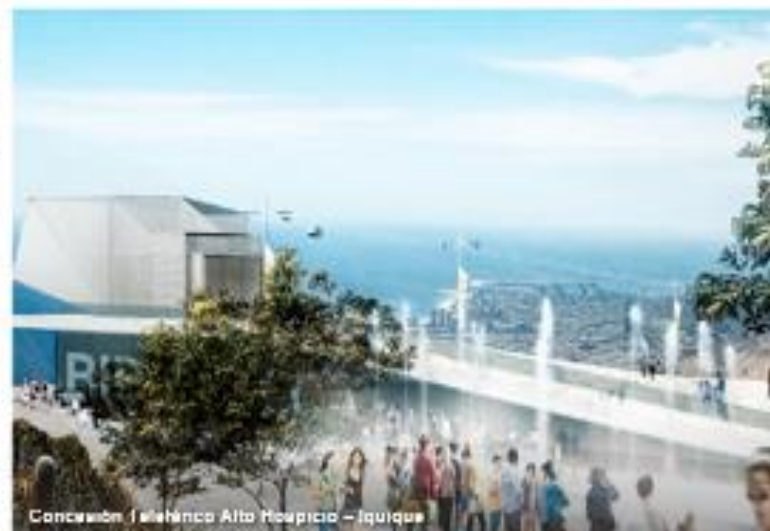
Concesión Ferrocarril Alto Hospicio - Iquique