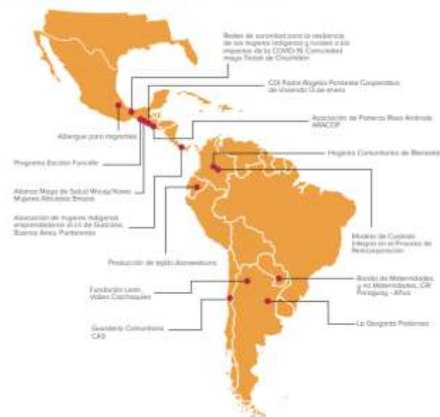
Cuadro 1. Mapeo con las experiencias de cuidados comunitarios