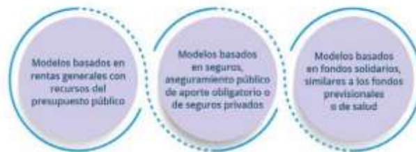
Diagrama 4. Modelos de financiamiento de los cuidados