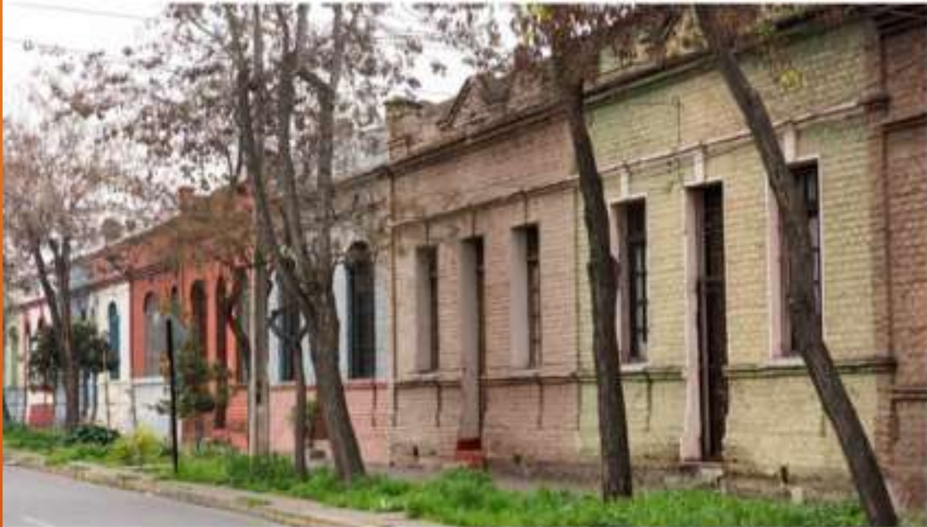
Foto: Tipología de vivienda representativa del sector.