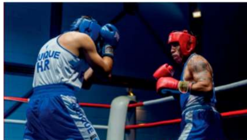
(La Estrella de Iquique)

07 de Febrero de 2024 | 16:49 | Por Bástian Valenzuela