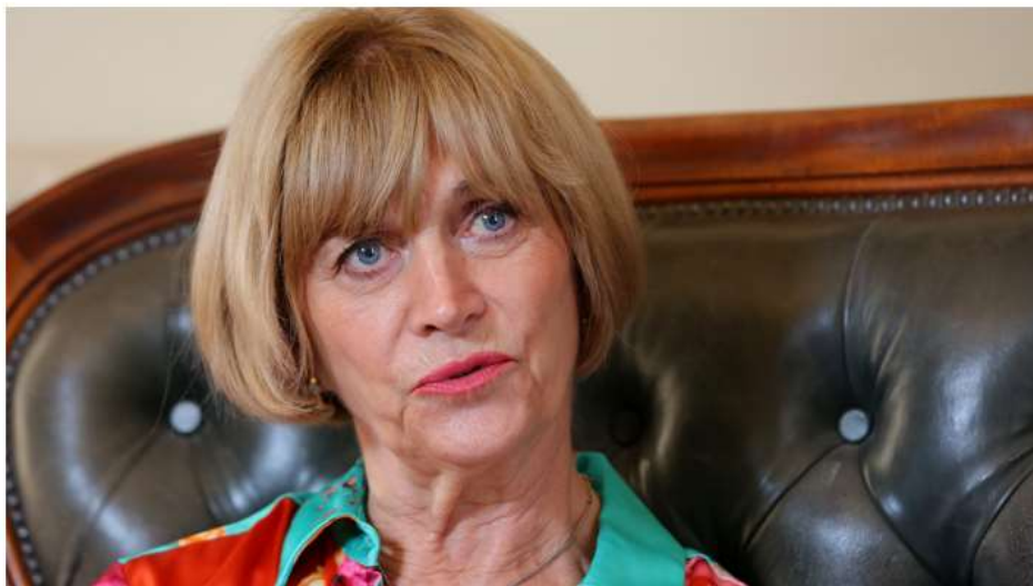
La jefa comunal hizo un llamado para que no sigan llegando personas al consulado boliviano.

28 de Abril de 2020 | 18:34 | Por Felipe Vargas, Emol