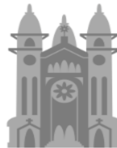
Patrimonio Cultural y Natural