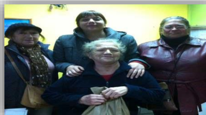
Programa Anfitrionas del CESFAM La Granja