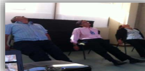
Talleres de Autocuidado