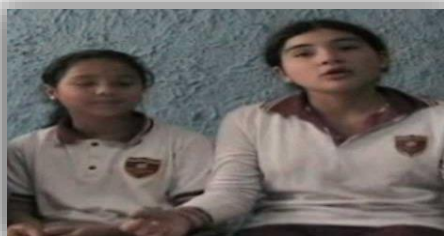
Programa Vivencial de Educación Sexual y Afectividad, dirigido a pre púberes y adolescentes