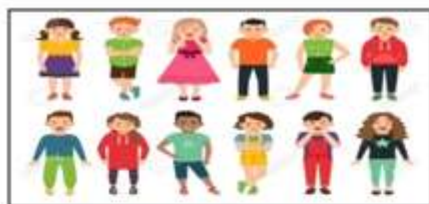
Niños, Niñas y Adolescentes