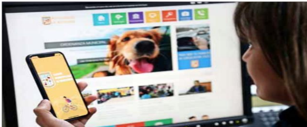
El sitio de Marchigüe es rápido, fácil de navegar y los trámites que se pueden realizar en línea se encuentran fácilmente. Además, tienen una aplicación para teléfonos.

Junto con el sitio web se evaluaron tres trámites en línea, elegidos por ser de los más solicitados: permiso de circulación, pa-