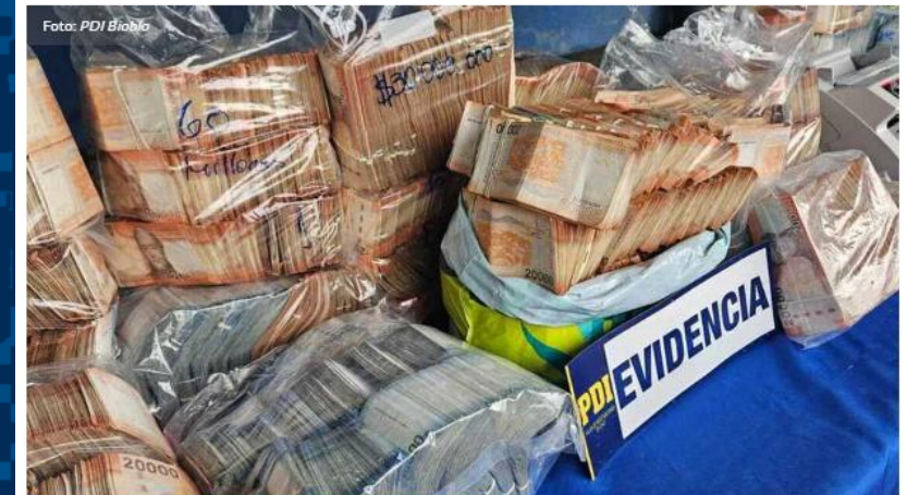
También se incautaron diversas drogas y armas.