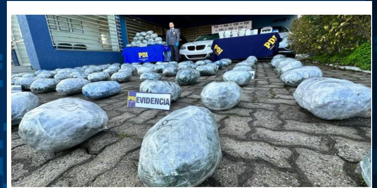
REGION DEL BÍO-BÍO La traían desde el norte del país: Detienen a cuatro sujetos con 136 kilos de droga en el Gran Concepción

Investigación vinculada a estructura Criminal con asentamiento en las comunas de Concepcion y Talcahuano, cuyos integrantes se dedicaban a la internación de importantes remesas de droga a la región, para ser acopiada y posteriormente ser distribuida a distintos receptores de la provincia, que culmino con la detención de 4 personas de nacionalidad chilena y la incautación de 136 kilos de Cannabis, 120 grs de Clorhidrato de Cocaína, 4 kilos de cafeína, 1 kilo 664 grs de Lidocaína, 03 vehículos y otras especies asociadas al ilícito.